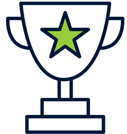
ISG Star of Excellence

Hier ist die E-Mail-Adresse: star@cx.isg-one.com